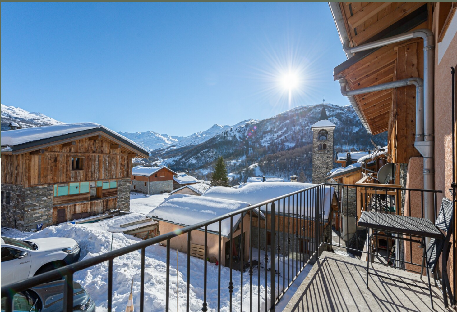
MAISON 4 PIÈCES - AU COEUR D'UN VILLAGE AUTHENTIQUE · SAINT-MARTIN-DE-BELLEVILLE