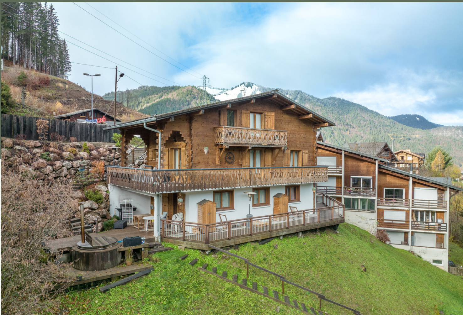
CHALET 6 CHAMBRES - VUE MONTAGNE/VILLAGE · MORZINE