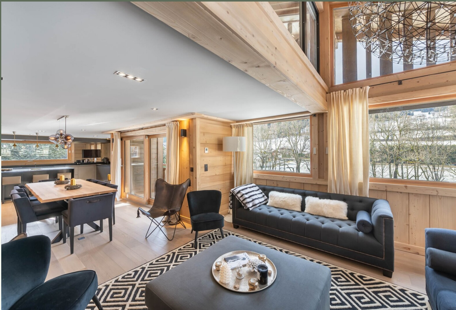
CHALET RENOVE - DEMI QUARTIER · DEMI-QUARTIER