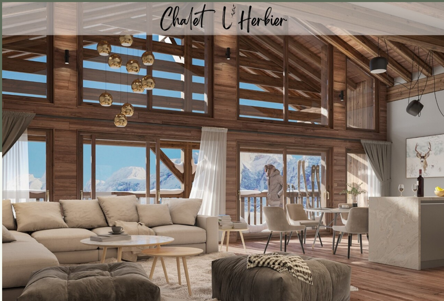
APPARTEMENT 4 PIÈCES BELLE EXPOSITION - L'HERBIER · MANIGOD